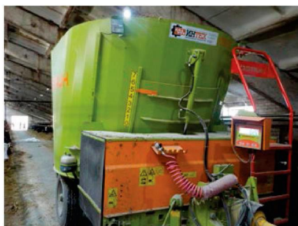
Смеситель-раздатчик кормов СРК-11В «Хозяин» в работе