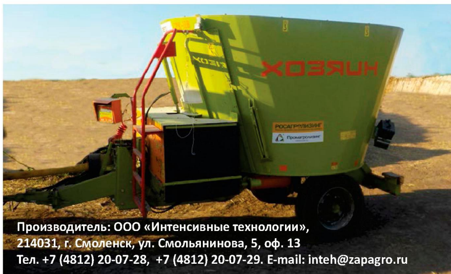
Производитель: ООО «Интенсивные технологии», 214031, г. Смоленск, ул. Смольянинова, 5, оф. 13 Тел. +7 (4812) 20-07-28, +7 (4812) 20-07-29. E-mail: inteh@zapagro.ru