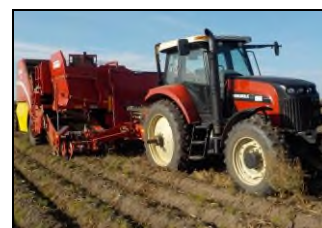
Комбайн SE-260 в агрегате с трактором Versatile 190 в работе

Испытательный центр ФГБУ «Поволжская МИС» 446442, Самарская обл. г. Кинель, пгт. Усть-Кинельский ул. Шоссейная, 82. Тел. (84663) 46-1-43. Факс (84663) 46-4-89. E-mail: info@povmis.ru, www.povmis.ru