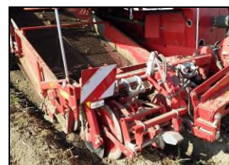
Комбайн SE-260. Секция подкапывания клубней картофеля

Производитель ООО «Гримме-Русь», 249080, Калужская область, Малоярославецкий район, п. Детчино, ул. Индустриальная, д. 3 Тел.: 8 (48431) 56-000 Факс: 8 (48431) 56-011 E-mail: grimme-rus@grimme.ru www.grimme.com/ru